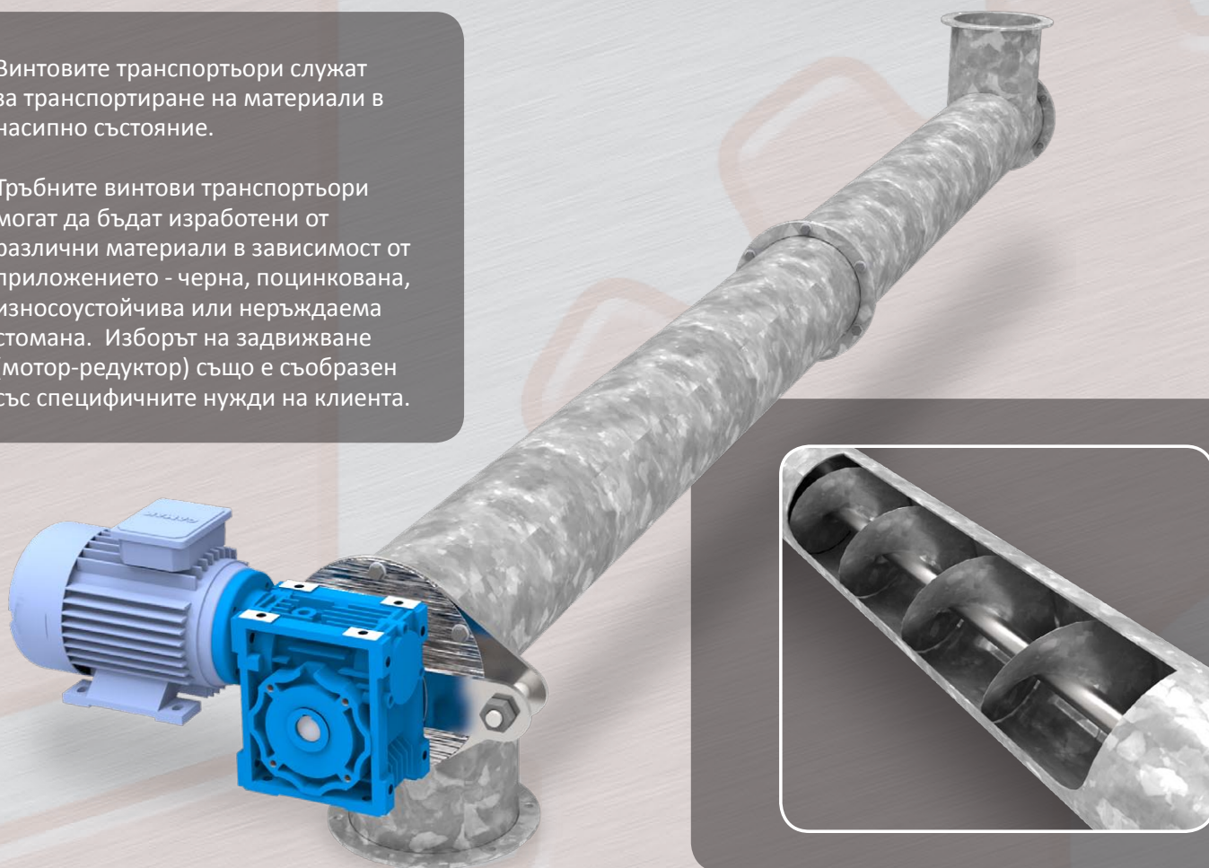
Тръбен винтов транспортёор от поцинкована стомана.

Тръбните винтови транспортёри могат да бъдат изработени от различни материали в зависимост от приложението - черна, поцинкована, износоустойчива или неръждаема стомана. Изборът на задвижване (мотор-редуктор) също е съобразен със специфичните нужди на клиента.